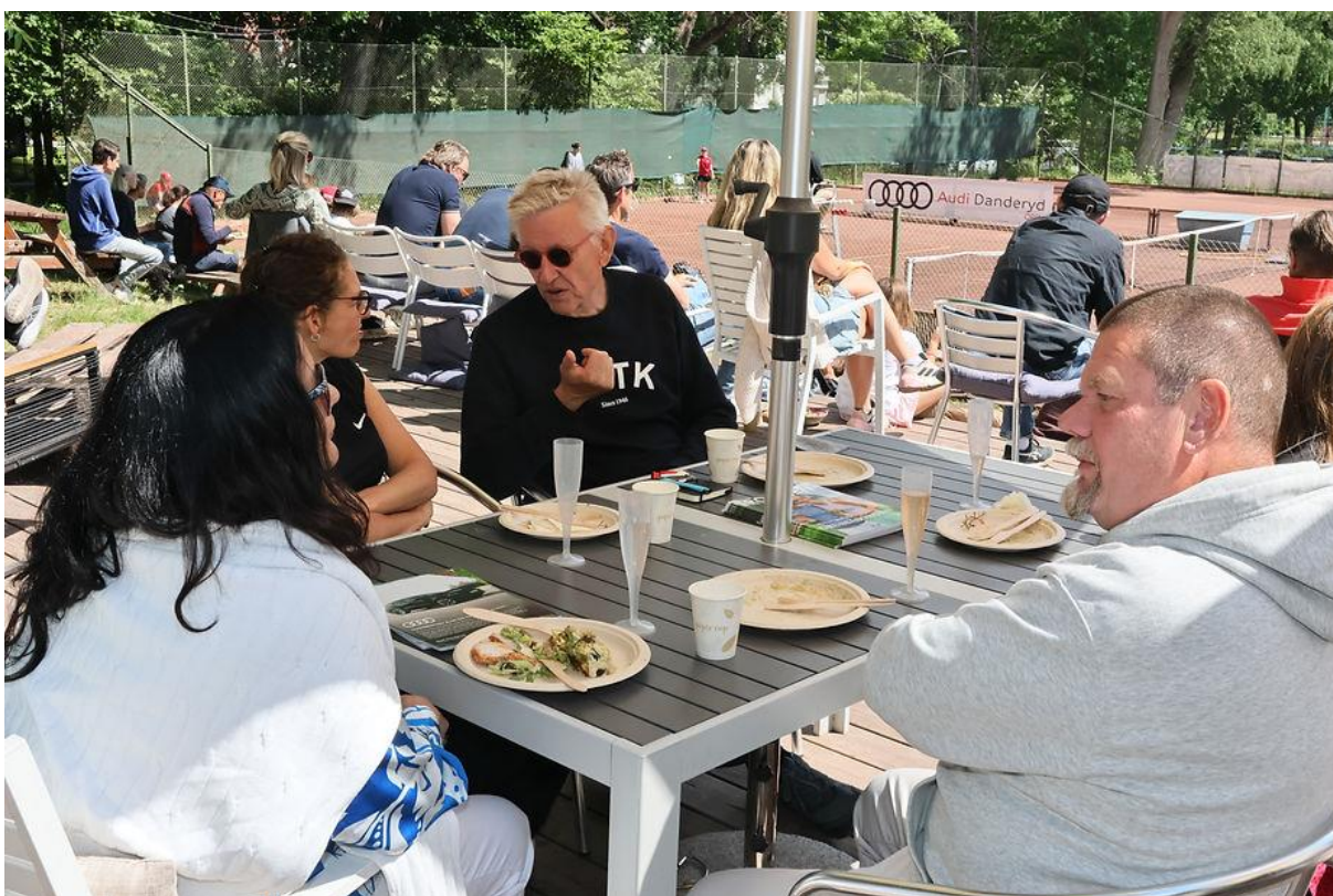
Under finaldagen av Audi Danderyd Open anordnades en buffé för klubbens ideella ledare och samarbetspartners. Cafét hade laddat med hamburgare och delikata bakverk för övriga besökare. Inbjudna var bland annat alla som hjälpt till Omed vårens tävlingsarrangemang, lokalpolitiker, sponsorer samt gäster från Stockholms Tennisförbund och Svenska Tennisförbundet. Över 100 åskådare var på plats.