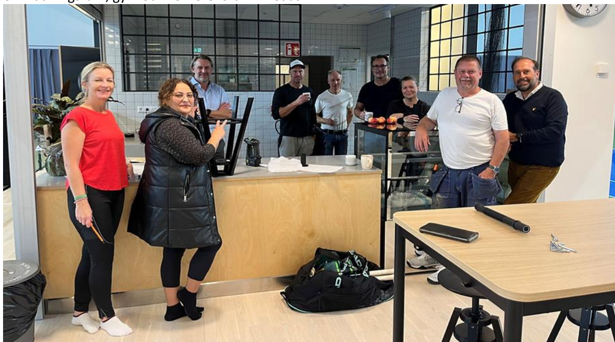
En del av de medlemmar som var på plats och skruvade möbler när vi fick tillträde till hallen.

Mycket arbete återstod för kommittén när hallen öppnats. En försvårande faktor var att klubben inte hade tillträde innan öppnandet ens för möblering. Möbler skulle skruvas, skynken bakom banorna komma upp, domarstolar, bänkar på banorna, hyllor i förråd monteras, caféet, kansli lokaler, omklädningsrum, gym och konferensrum inredas.