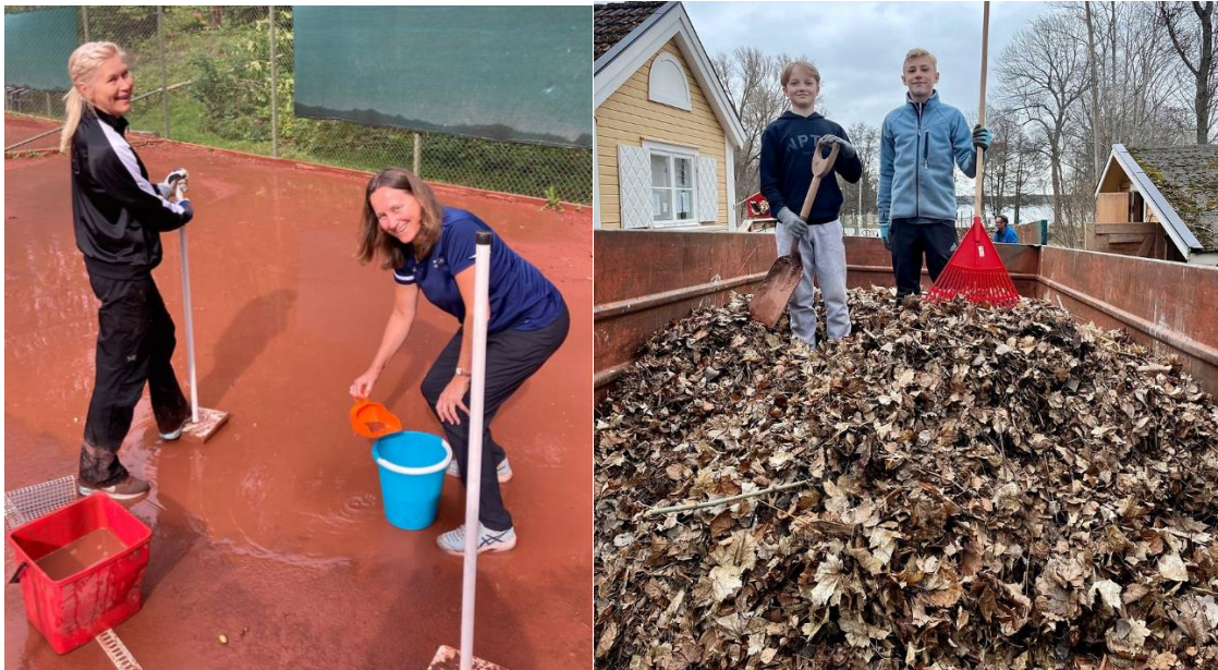
Bägge städdagarna var mycket välbesökta. Cirka 50 medlemmar kom på hösten och 80 på vårstädningen.

Den 29 april kunde banorna öppnas för spel. Det möjliggjordes tack vare att medlemmarna slöt upp på städdagen och att tävlingsveteraner, juniorföräldrar och personal jobbade med banorna.