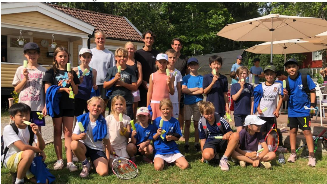
Bra banor, härlig miljö och ett café där man kan få mellanmål och kanske en glass efter träningen. Bättre sommarlov än så kan man inte ha på härliga Näsaäng!

Under sommaren har det klippts gräs och rensats ogräs med mera. Dock inte i den omfattning som krävs om anläggningen ska vara i toppskick. Styrelsen kommer att titta på en bättre lösning inför kommande utomhussäsong.