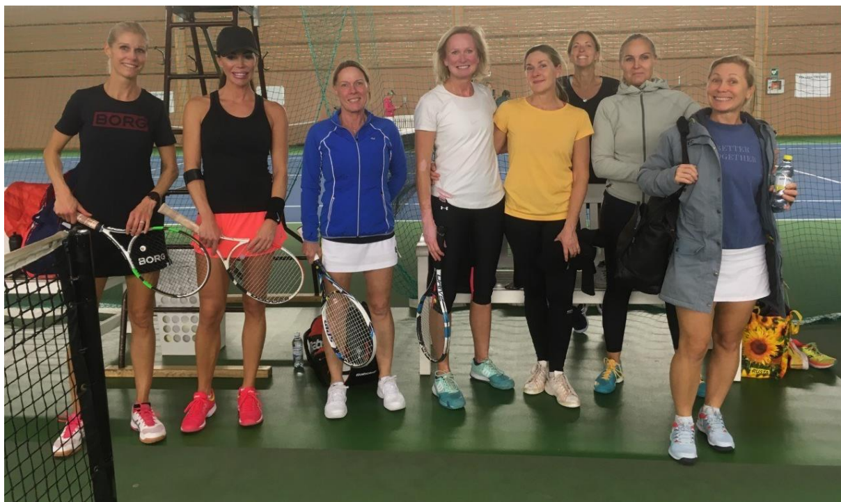
Damdubbelkvällen i Sollentuna Rackethall med 25 damer blev mycket uppskattad.

Glädjande är också att tävlandet bland damerna har ökat markant både internt och externt. 30 damdubbelpar deltog i utomhus-KM!