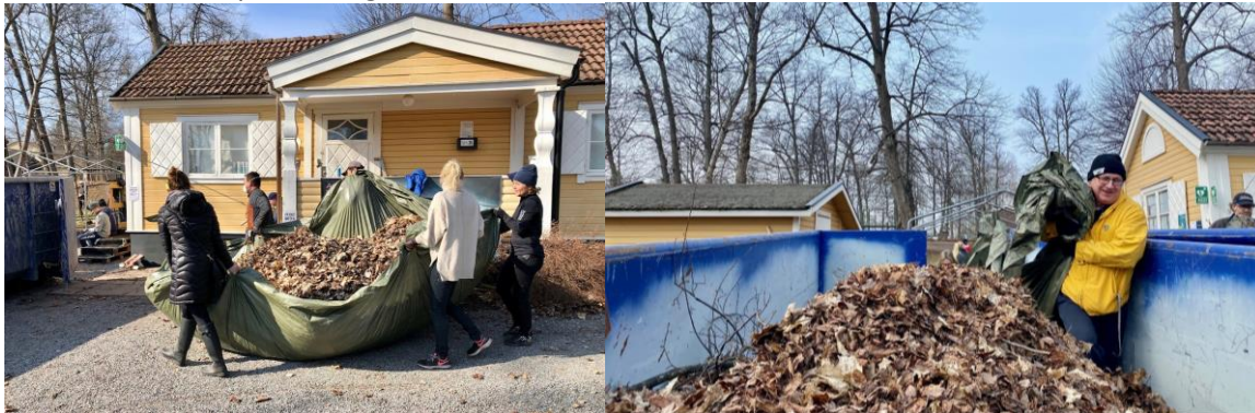
Löv och annat bråte rensades bort med rasande fart. Det innebar att det gick att börja jobba med banorna direkt efter städdagen.

Arbetet med att iordningsställa banorna och anläggningen fick en fantastisk start då nästan 100 medlemmar kom på städdagen! Området var indelat i zoner.