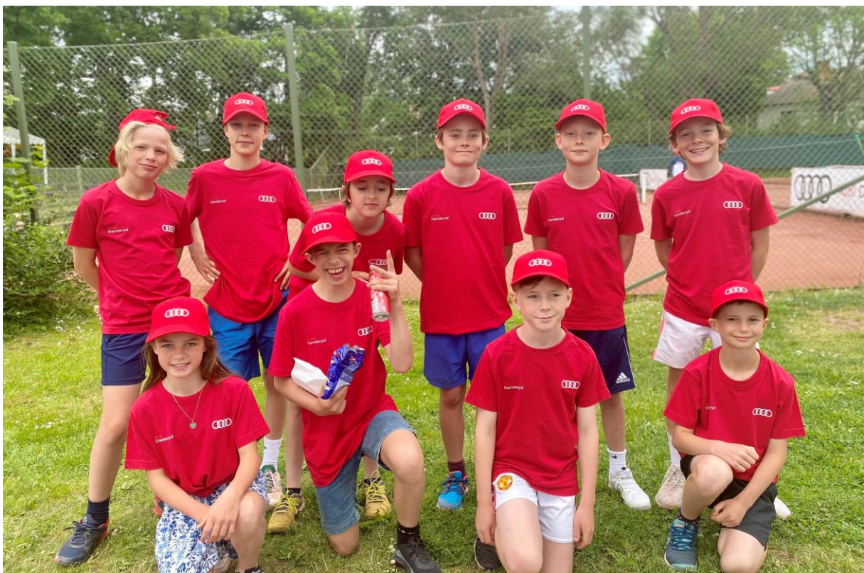
Bollkallarna skötte sig i vanlig ordning med den äran!

Ett stort tack också till vår tävlingsponsor Audi Danderyd som gett oss möjlighet att utveckla våra tävlingar och kringarrangemang.