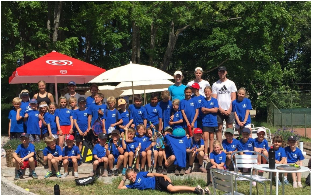
Efter en lång vinter utan en egen tennishall var det kul att vara med på tennisläger på Näsaäng!

Under sommarlovet arrangerades traditionsenligt sju mycket populära sommarlägerveckor.