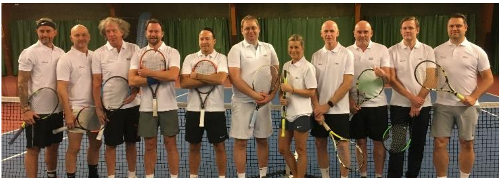
Under året arrangerades det en clinic för Audi Danderyd i samband med Davis Cup matchen mot Chile.