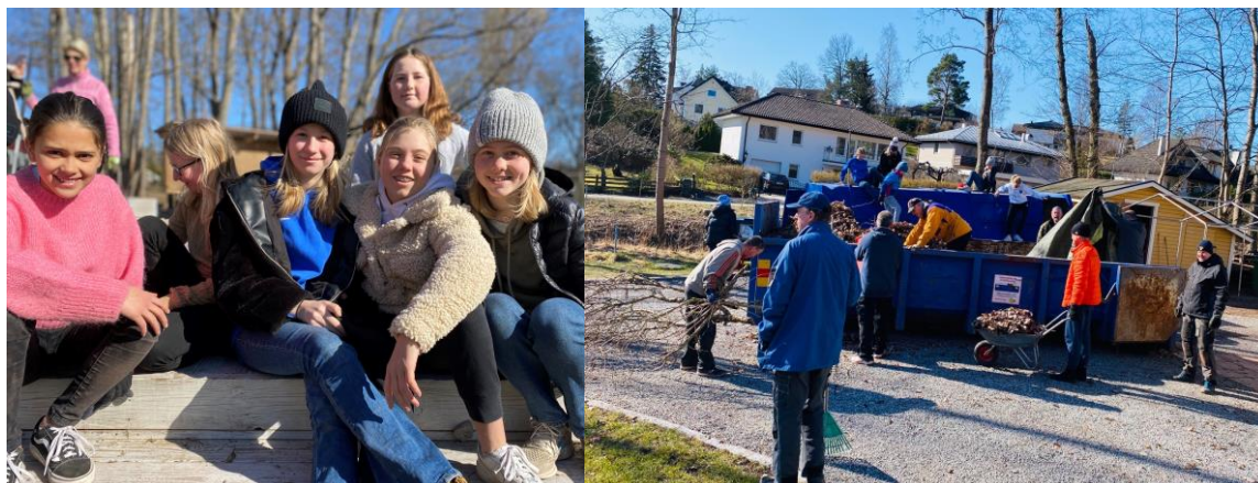
Det kom cirka 80 medlemmar till städdagen!

Satsningarna på sociala aktiviteter har bidragit till att stärka det ideella ledarskapet och klubbkänslan.