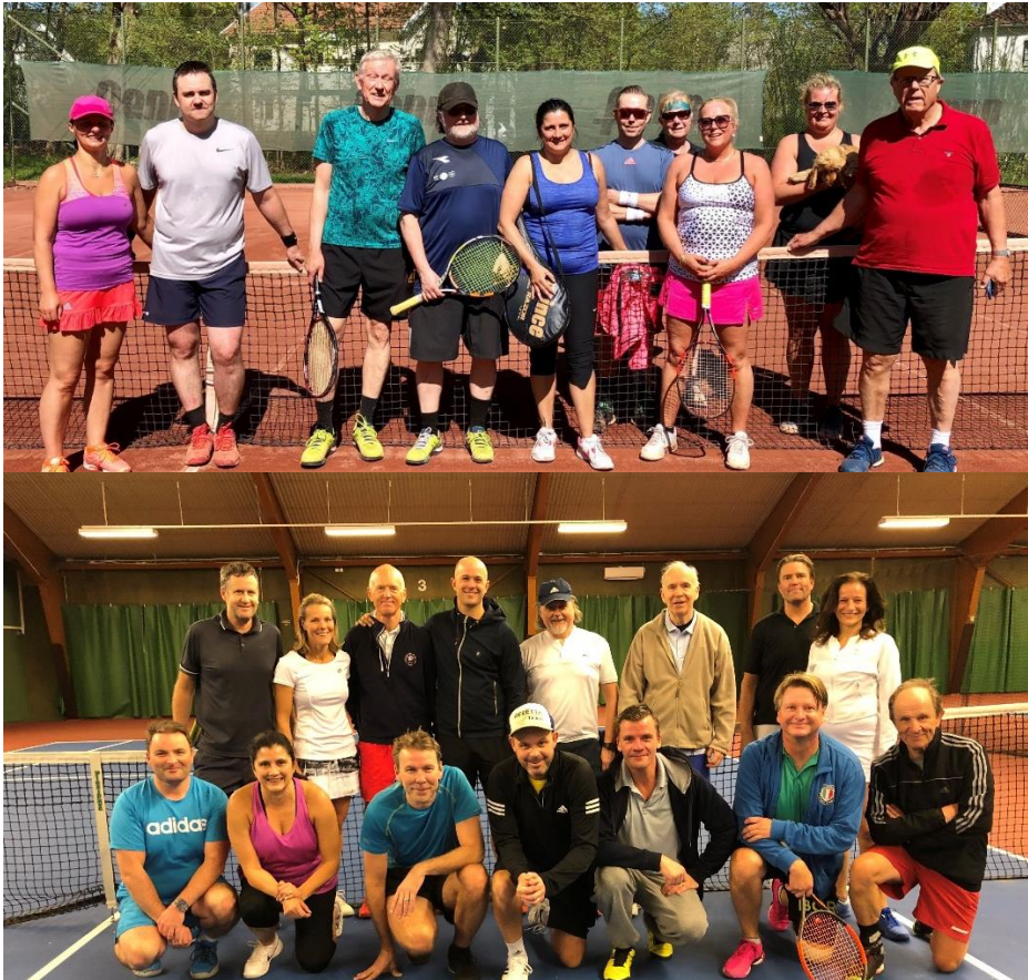
Samtliga Drop-in aktiviteter fortsatte att öka. Vid det första speltillfället för torsdagstennisen kl. 12-13 på Näsaäng kom det 30 deltagare. På årets Frukosttennis deltog 45 olika unika medlemmar.

Klubben har under året haft sex drop- in aktiviteter; Torsdagstennisen kl. 12-13, Frukosttennis , på fredagar kl. 07-8.30 (inklusive frukost), Träning med lunch kl. 12-14 på Näsaäng på onsdagar, Dubbeltennis på torsdagskvällarna på Näsaäng, Lördagstennisen på Näsaäng kl. 13-15 och Damtennisen på söndagar kl. 18-20.