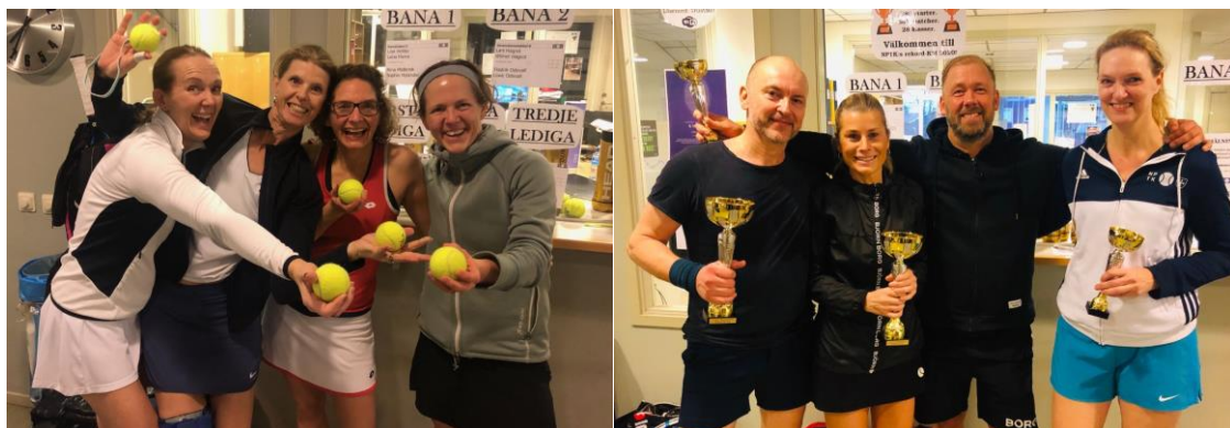
Bilder från inomhus-KM. Deltagarantalet i Klubbmästerskapen fortsatte att växa. 33 Damdubbelpar och 51 mixeddubbelpar är kanske de siffror som sticker ut mest!

Klubbmästerskapen satte återigen nytt deltagarrekord både inom- och utomhus! Inomhus-KM samlade 264 deltagare (f.å 240) som gjorde 390 starter (f.å 374). I Klubbmästerskapen utomhus deltog 225 (f.å 214) medlemmar som gjorde 387 starter (f.å 329). Det innebär att över 20 % av klubbens medlemmar deltog i KM!