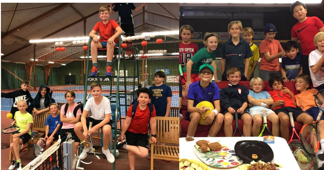
Massor av matcher spelades på kort tid i Lilla KM. Fikat efteråt var minst lika viktigt!

Tennisskole-KM arrangerades i december och juni. Målsättningen med evenemanget är att låta de som inte tävlar regelbundet få upptäcka hur kul det kan vara att spela match. Samtliga deltagare fick medalj. Sista dagen stod korvätning och medaljutdelning på programmet. Båda tävlingarna samlade cirka 50 deltagare.